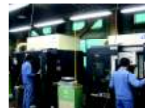
高速マシニングセンター