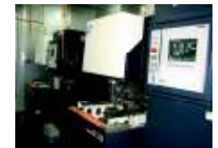
ワイヤー放電加工機